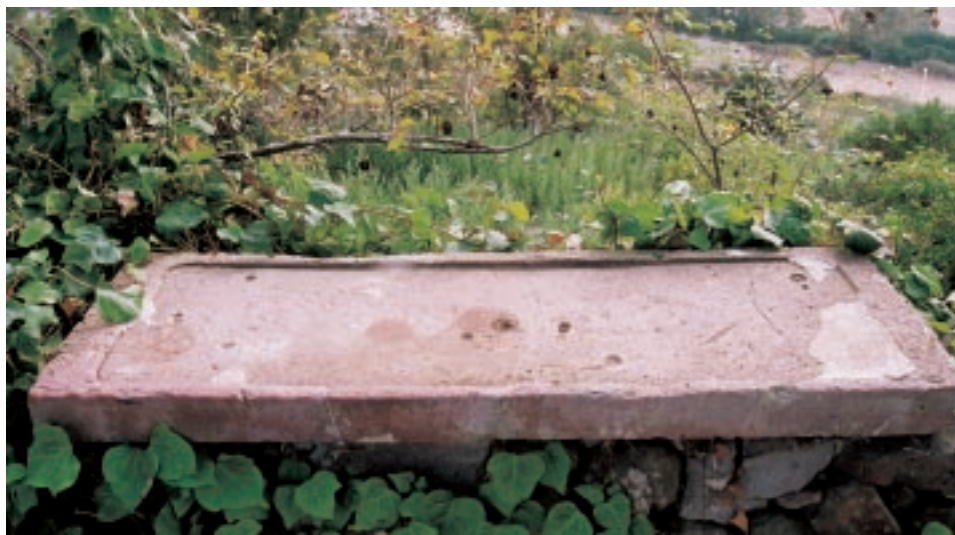
Fig. 9 - Antico scolatoio in pietra di proprietà della famiglia Addis di Tergu