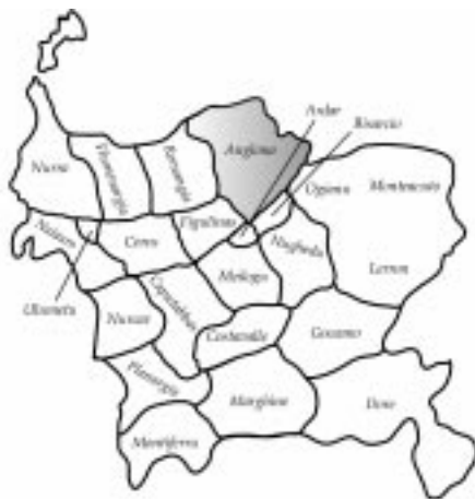
Fig. 1 - Territorio dell'Anglona nel Regno di Torres

L'attività agricola anglonese era prevalentemente orientata verso la cerealicoltura come testimoniato dalla presenza di diversi mulini ( Molendinu de Cericha, Molendinu de Laterana, Molendinu de Sabonatorgia, Mulendinu de ventu presso Castelsardo, Molinu in Santu Pedru de Fiumen in territorio di Bulzi e Molinu sutta a Santu Nigola de Jspeluncas in territorio di Sedini) e dal pagamento di terreni, anche viticoli, in carritas di grano. Oltre ai cereali avevano una certa importanza la vite, i frutteti, i seminativi ed i canneti. L'attività zootecnica, praticata nei prati comunitari ( padru ), uno o più per ogni villaggio, e nei recinti ( bulvari, sa mandra, mandra porchina, suiles ), prevedeva l'allevamento di vacche, pecore e capre (... baccas, berbeces, capras... ) come risulta dalle citazioni nei documenti di donazione ai