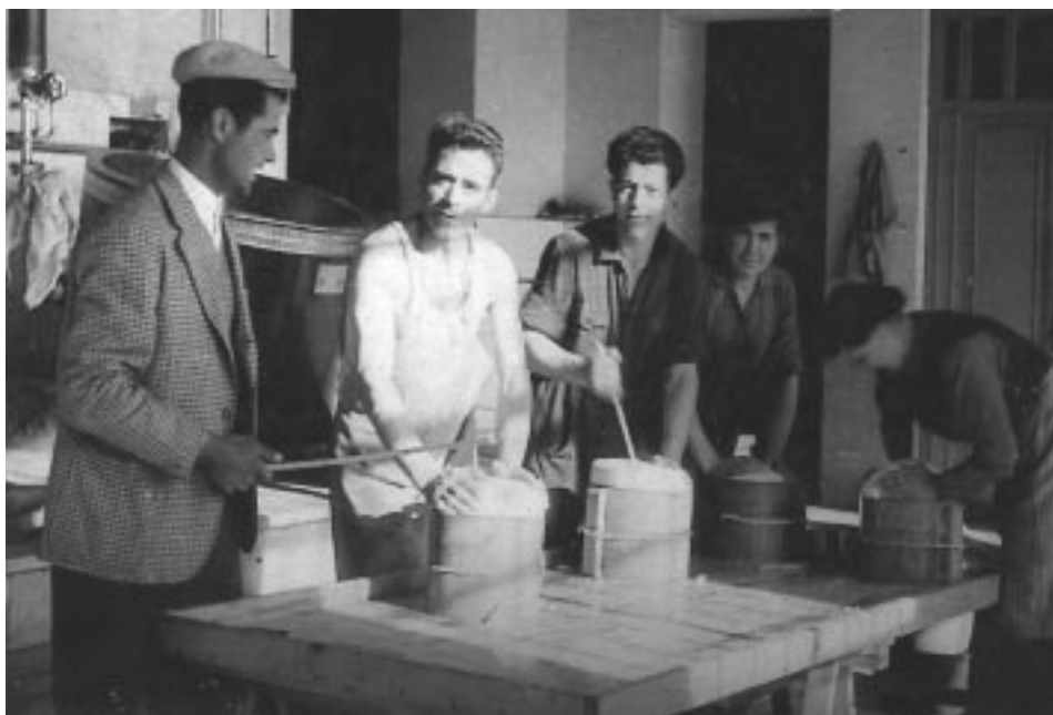
Perfugas anni 50: lavorazione del Pecorino Romano

Negli anni '70 l'ingresso di soci allevatori di vacche brune nella Società Cooperativa Pastori Perfughesi determinò l'avvio della produzione di paste filate che divenne negli anni elemento caratterizzante l'impresa.