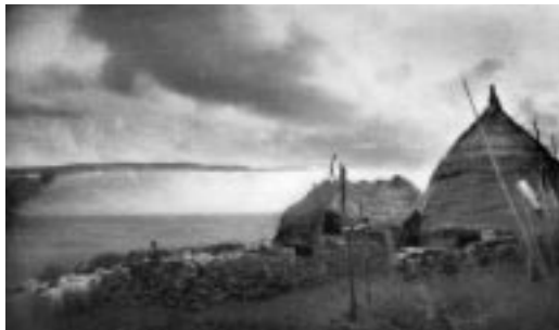
Fig. 2 - Pinnetas in agro di Castelsardo

Al termine del XIX secolo la produzione casearia isolana derivava da una attività di tipo familiare esercitata in piccole capanne circolari, sas pinnetas , prive di aria e di luce, costituite da un muro basso di pietra ed un tetto conico di frasche (Fig. 2). Venivano impiegate caldaie in rame o in ferro battuto non stagnato, mestoli e forme di legno o sughero; la filtrazione del latte era scadente, così come la qualità del caglio, gli accorgimenti tecnologici e l'igiene. Il formaggio presentava pertanto notevole variabilità, mentre le esigenze del mercato richiedevano un prodotto di qualità e pezzatura costante. Il pastore sardo vendeva il formaggio ai commercianti per un prezzo oscillante tra 35 e 50 lire al quintale.