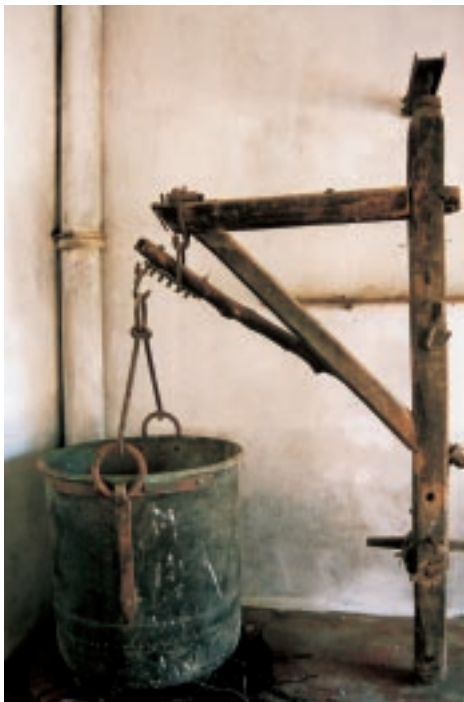
Fig. 7 - "Sa labia". Caldaia in rame appartenente alla famiglia Addis di Tergu. E' sostenuta da un argano in legno detto "su criccu". Nella fossa sottostante venivano bruciate fascine per scaldare il latte