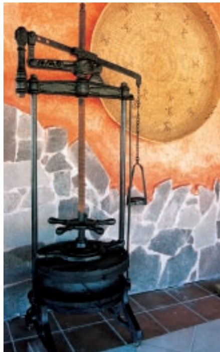
Fig. 8 - Pressa per il formaggio risalente ai primi del '900, appartenente all'azienda agrituristica Elli Pes di Nulvi